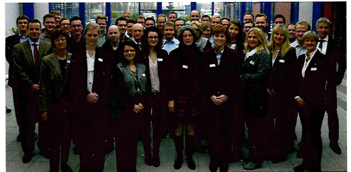
Auftakt: Am neuen Cross-Mentoring-Projekt zur Fachkräfteentwicklung nehmen acht Unternehmen teil.

T eilnehmer sind 15 Mentoring-Tandems aus acht Unternehmen, die aus BerufseinsteigerInnen und erfahrenen Fachkräften bestehen. Im Cross-Mentoring durchlaufen die Mentees und MentorInnen eine Qualifizierungsreihe zu Themen wie Selbstmanagement, Kommunikation im Team und Positionierung im Unternehmen. Dadurch können sie ihre eigenen Kompetenzen erweitern und eine individuelle Karriereplanung systematisch angehen. Außerdem findet in der Tandem-Arbeit wie auch in den gemeinsamen Workshops ein intensiver Erfahrungsaustausch statt, der die beruflichen und regionalen Netzwerke aller Beteiligten stärkt. „In allen Workshops arbeiten Mentees, Mentorinnen und Mentoren gemeinsam an aktuellen Themen und lernen unterschiedliche biografische Erfahrungen, Bewertungen und Haltungen kennen. So profitieren beide Altersgruppen und lernen einander besser zu verstehen, was vor allem den Berufseinsteigern und -Einsteigerinnen in ihrer täglichen Kommunikation hilft. Der altersübergreifende Austausch fördert daher in den Firmen auch eine offenere Kultur zwischen den Generationen und Geschlech-