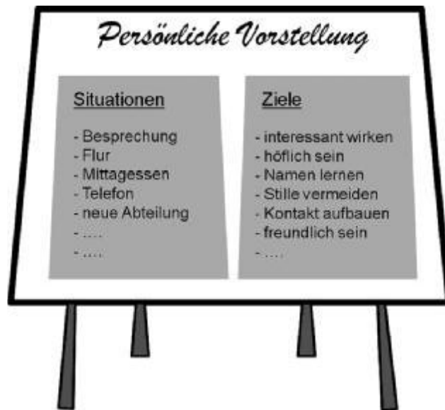
Abb. 4: Flipchart „Persönliche Vorstellung“