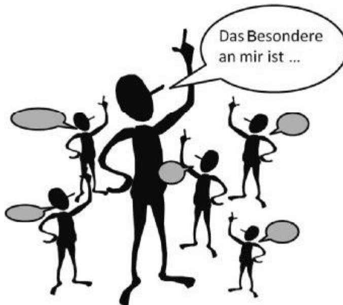
Abb. 6: Konkrete Vorstellung

Hinweis: Unterbinden Sie an dieser Stelle etwaige aufkommende Kritik an der Selbstdarstellung der Auszubildenden. Die positive Resonanz im Plenum ermöglicht die Stärkung des Selbstwertgefühls des Einzelnen und mindert die Nervosität für anstehende Vorstellungsrunden. Jede persönliche Vorstellung sollte mit Applaus honoriert werden.