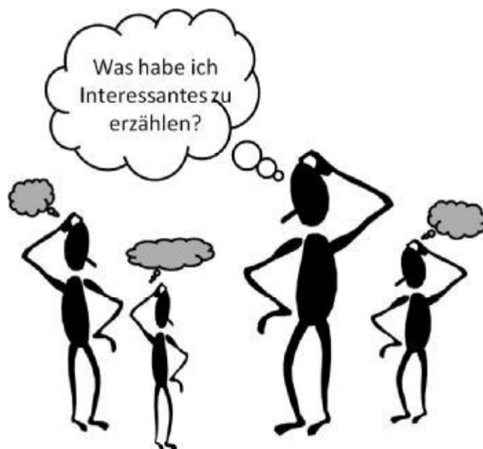
Abb. 5: Interessante Vorstellung

Hinweis: Es eignet sich oft vor dem dritten Schritt kurz zu thematisieren, was unter einer gezielten Rückmeldung zu verstehen ist, und konkrete Feedbackregeln mit allen gemeinsam zu vereinbaren.