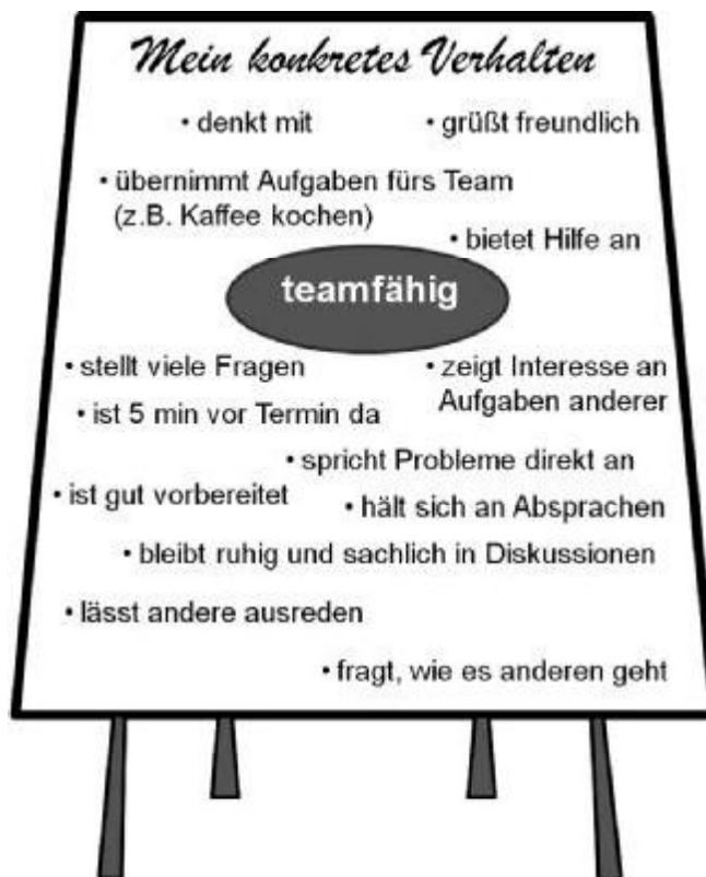
Abb. 2: Metaplan „Verhalten“

Um auf die Vielfalt der zu beeinflussenden Faktoren beim eigenen Image hinzuweisen, bietet es sich an, bei den Fragen zu den Eigenschaften auf drei Aspekte einzugehen: Welches Verhalten kann ich zeigen? Welche Kommunikation vermittelt den gewünschten Eindruck? Und welches Aussehen/welche Kleidung unterstreicht mein gewünschtes Image? (Zeit: 20 Minuten)