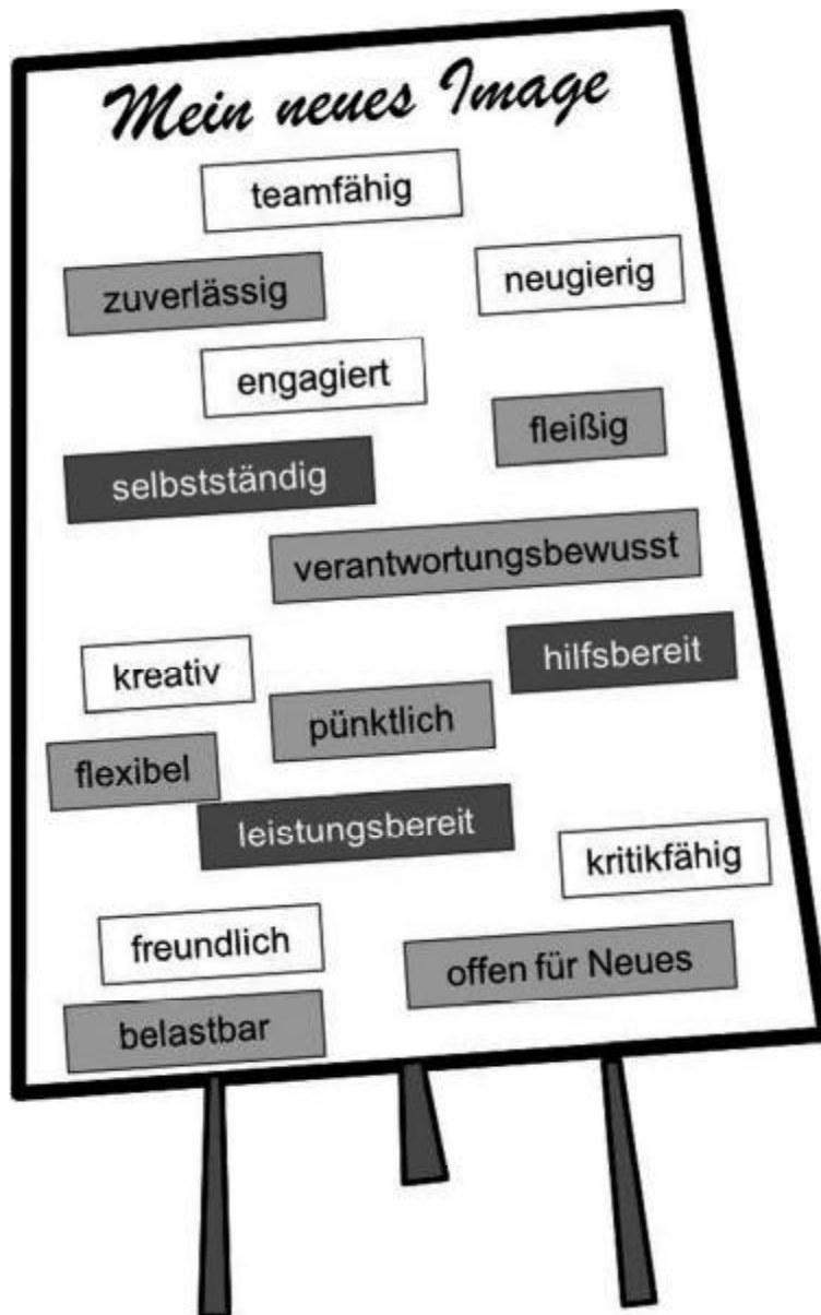
Abb. 1: Flipchart „Eigenschaften“